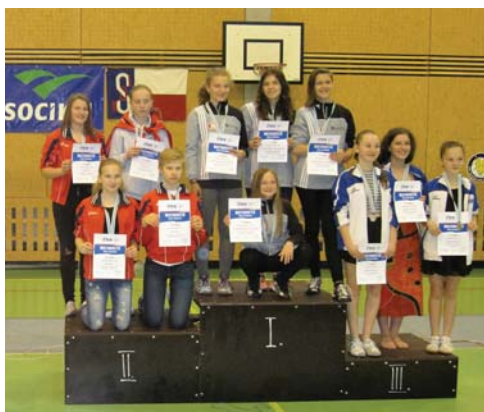
Družstvo žáčků na 1. místě

Oddíl děkuje všem sponzorům zejména: WeraWerk s.r.o., ZDT Nové Veselí s.r.o., Železárný Štěpánov s.r.o, Fides Agro s.r.o.