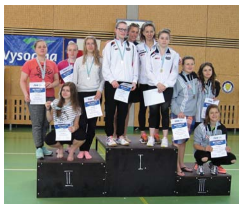
Družstvo seniorek na 3. místě