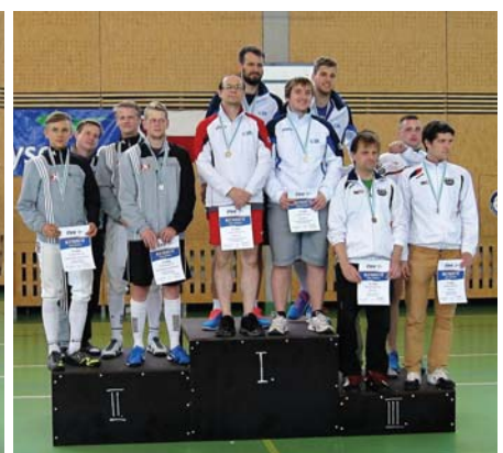
Družstvo seniorů na 2. místě