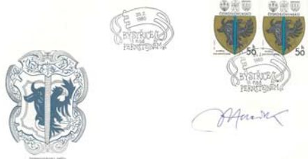
Velká počet města z roku 1580

Informace: Ant. Ráčil, Spojovací 921, ra.antonin44@seznam.cz , 774 115 870.