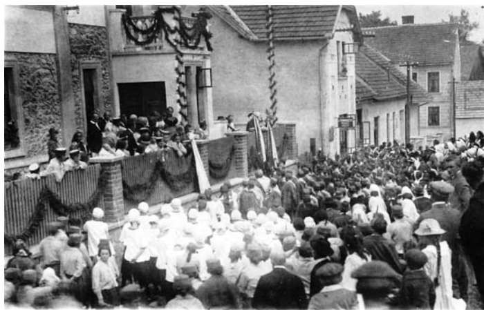
Slavnostní svěcení Orlovny

Zpracováno podle Stručného přehledu založení a činnosti Jednoty Československého Orla v Bystřici nad Pernštejnem v letech 1921 až 1932“ od Františka Dvořáčka.