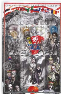
46. Year of the Czech Postage Stamp 2016