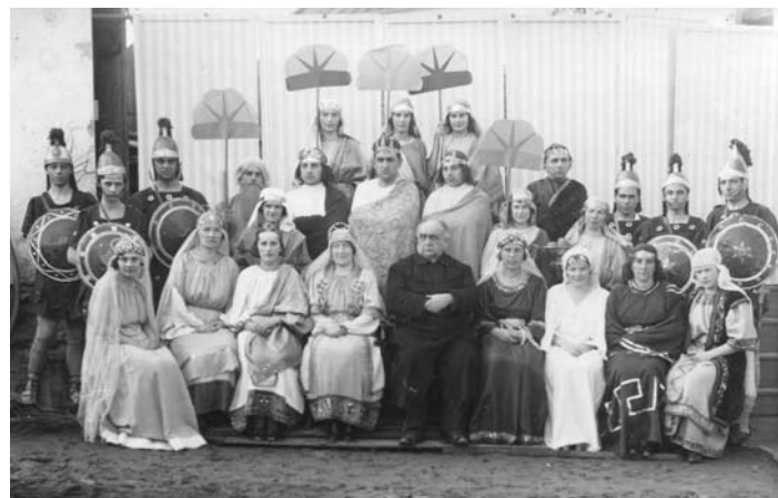
Účinkující ve hře Kristus vítězí