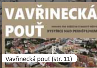
Vavřínecká pouť (str. 11)