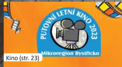
Kino (str. 23)