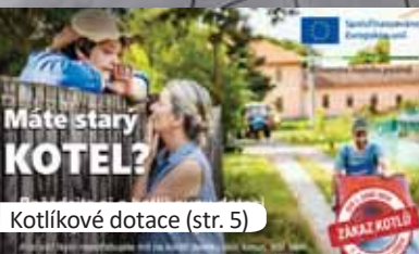
Kotlíkové dotace (str. 5)