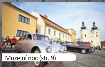
Muzejní noc (str. 9)