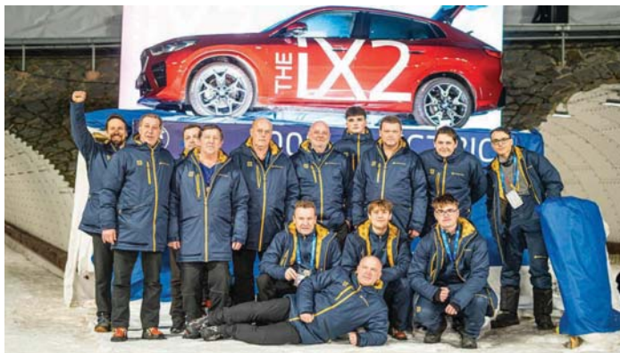
Jirku poznáte snadno, je to ten v modré bundě se zlatým límečkem. Pro přesnění nemá kulicha.