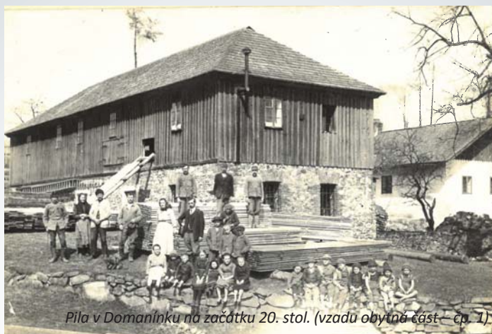
Pila v Domanínku na začátku 20. stol. (vzadu obytná část – čp. 1)