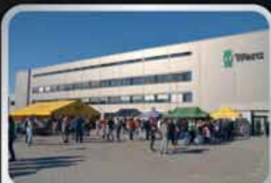
Pátá hala měla svoji premiéru.