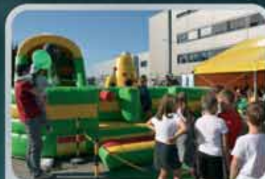
Nejlepší kombinace pro naše nejmenší rebely - skákací hrad a krásné počasí.