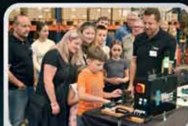
Svoji zručnost si vyzkoušeli malí i velcí rebelové.