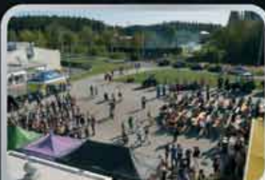
Všichni si našli „svůj“ stánek.