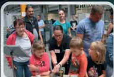
Zájem o techniku mají nejenom kluci.