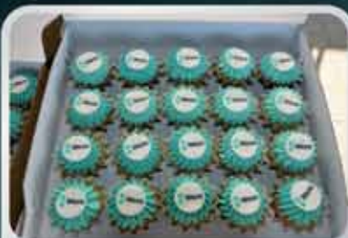
WERA k nakousnutí...