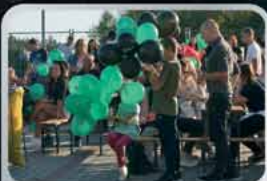
WERA barvy letí!