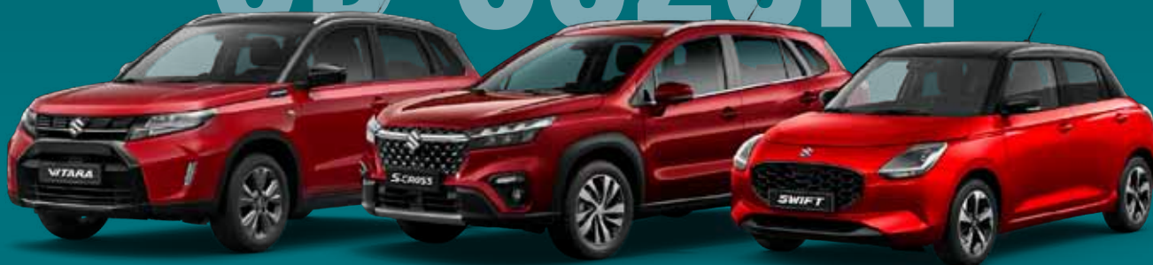
Suzuki Vitara praktické SUV