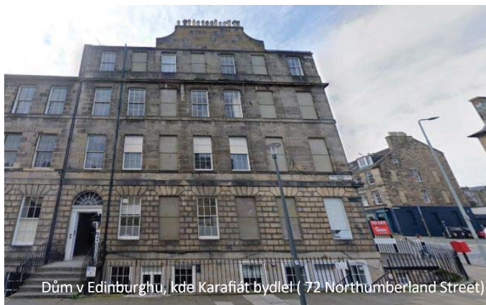
Dům v Edinburghu, kde Karafiát bydlel ( 72 Northumberland Street)