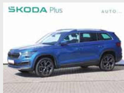
Škoda Kodiaq Style 2,0 TDI, 110 kW, automat