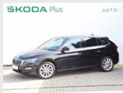
Škoda Scala Style 1,5 TSI, 110 kW, manuál