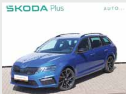
Škoda Octavia Combi RS 2,0 TSI, 180 kW, automat