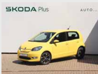
Škoda e-Citigo Style 37 kWh/61 kW, automat