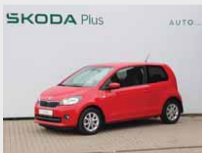
Škoda Citigo Elegance 1,0 TSI, 44 kW, automat