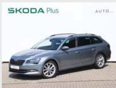
Škoda Superb Combi GRT Style 2,0 TDI, 110 kW, automat