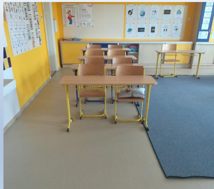
Obr. 8 - Rekonstrukce podlahy v I. a II. třídě ZŠ Rozsochy