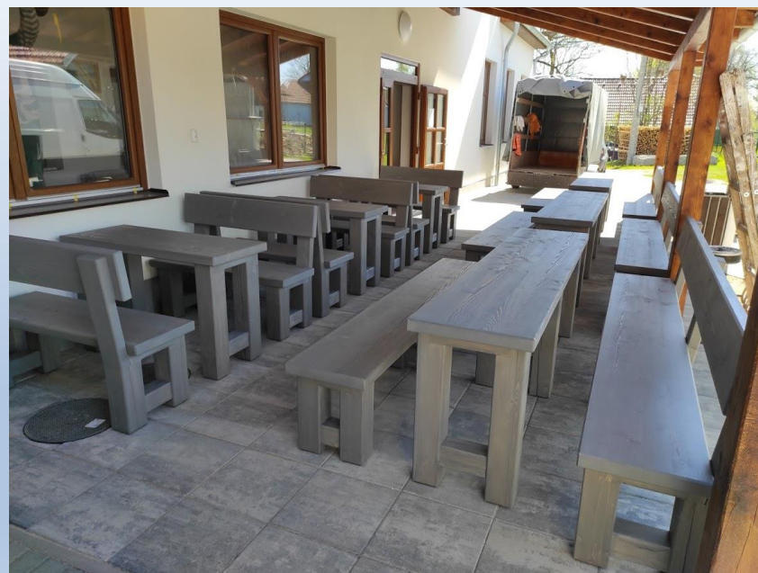
Obr. 6 - Posezení u kulturního domu v obci Dlouhé