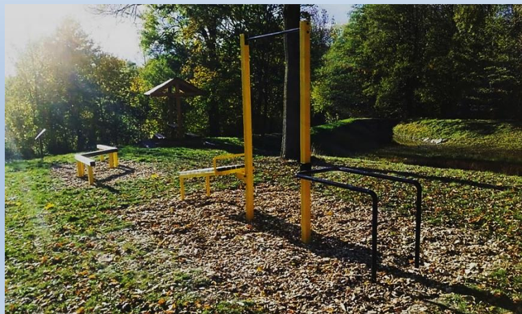
Obr. 9 a 10 – Ilustrační foto – Fit stezka (Sulkovec, Radešín)