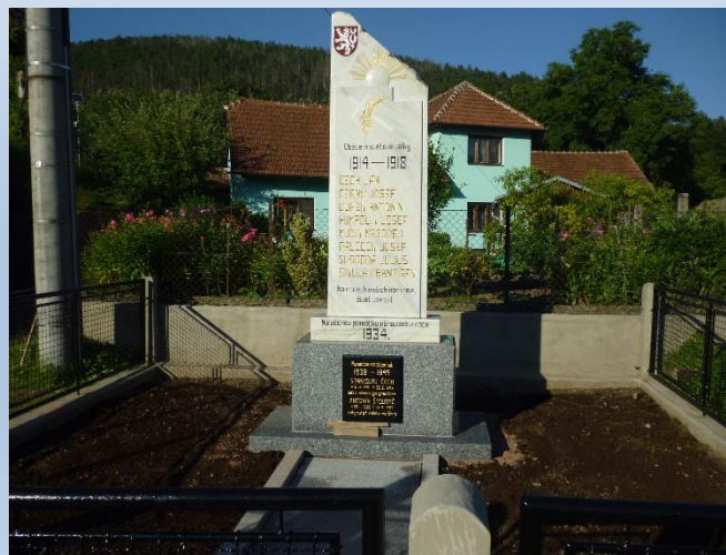
Obr. 2 – Drobné úpravy veřejného prostranství v obci Černvín