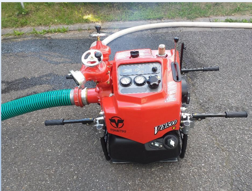
Obr. 3 – Nákup nové hasičské techniky JSDH Tři Studně

Typ podporovaných projektů – Hasiči – JPO V.: