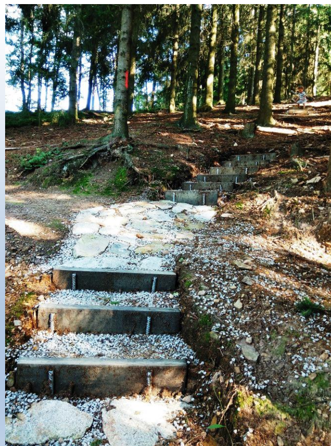
Obr. 11 a 12 - Lesní stezka při lomu na kopci Hora v Bystřici nad Pernštejnem