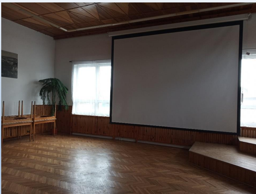
Obr. 5 – Vybavení Obecního domu Radešinská Svratka

Typ podporovaných projektů – kulturní a spolková zařízení: