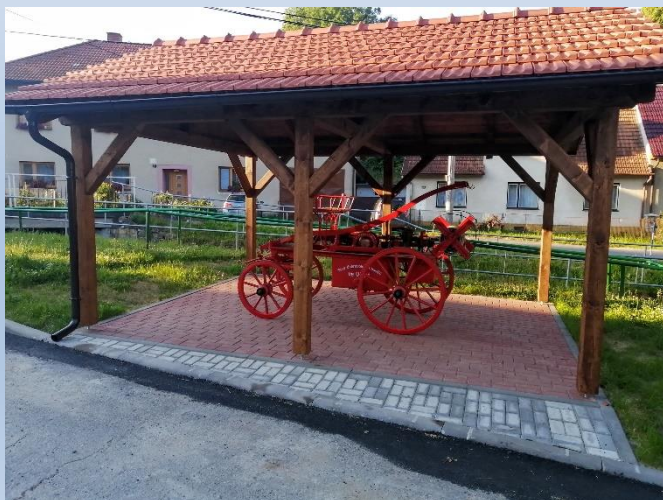
Obr. 1 – Úprava veřejného prostranství obec Věžná