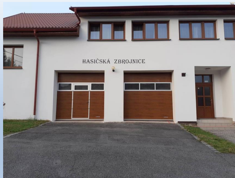
Obr. 4 – Výměna oken, dveří a vrat na hasičské zbrojnici Javorek