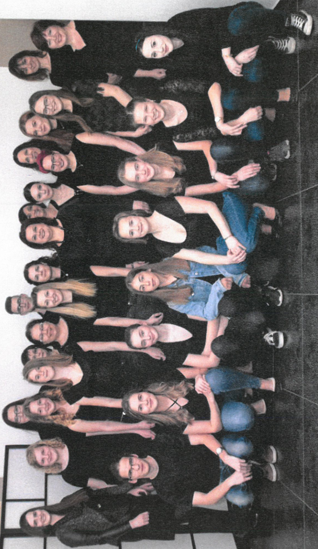
SMYČKOVY' DĚČNICE N. KYJOVSKÉHO - SOUČASNĚ' OBRAŽENÍ /