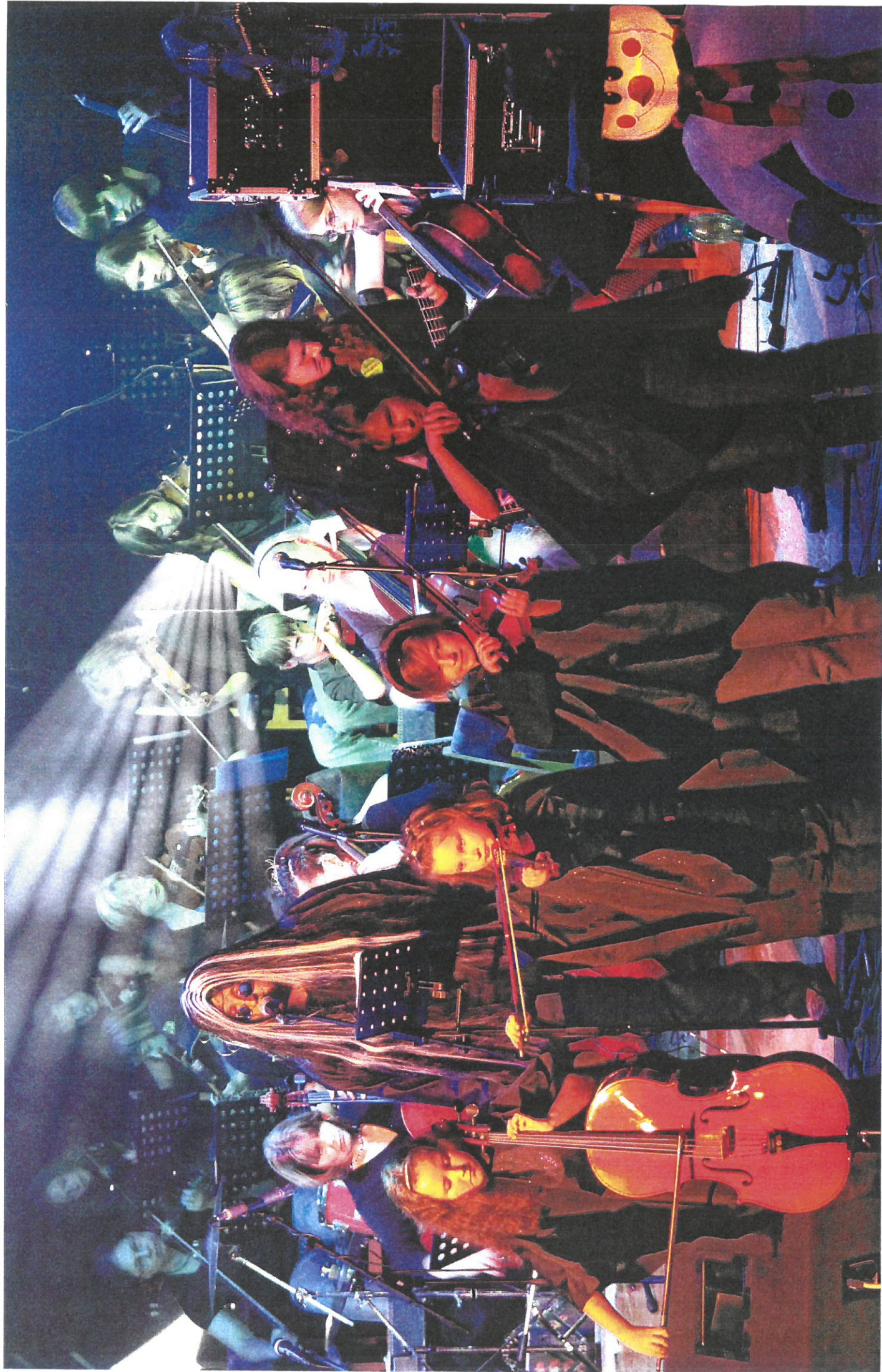
СЛУЖБОВИ ОДЕЖ. И. КИРИЛОВСКИЈА - БАЛАДА И РОМАНС