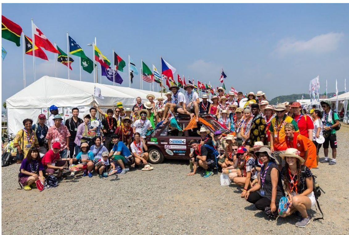
Světové setkání skautů - Jamboree v Japonsku

Vedle ostatních volnočasových aktivit pro děti zaujímá skauting zvláštní místo. Skaut není pouze o pohybu a pobytu v přírodě. Není ani pouhým zájmovým kroužkem pro děti. Skauting je především celosvětové hnutí, které se snaží o výchovu dětí a mladých lidí o rozvoj a seberozvoj jejich schopností a dovedností. Ač je pro děti zábavou, jeho poselství a cíle jdou mnohem více do hloubky.