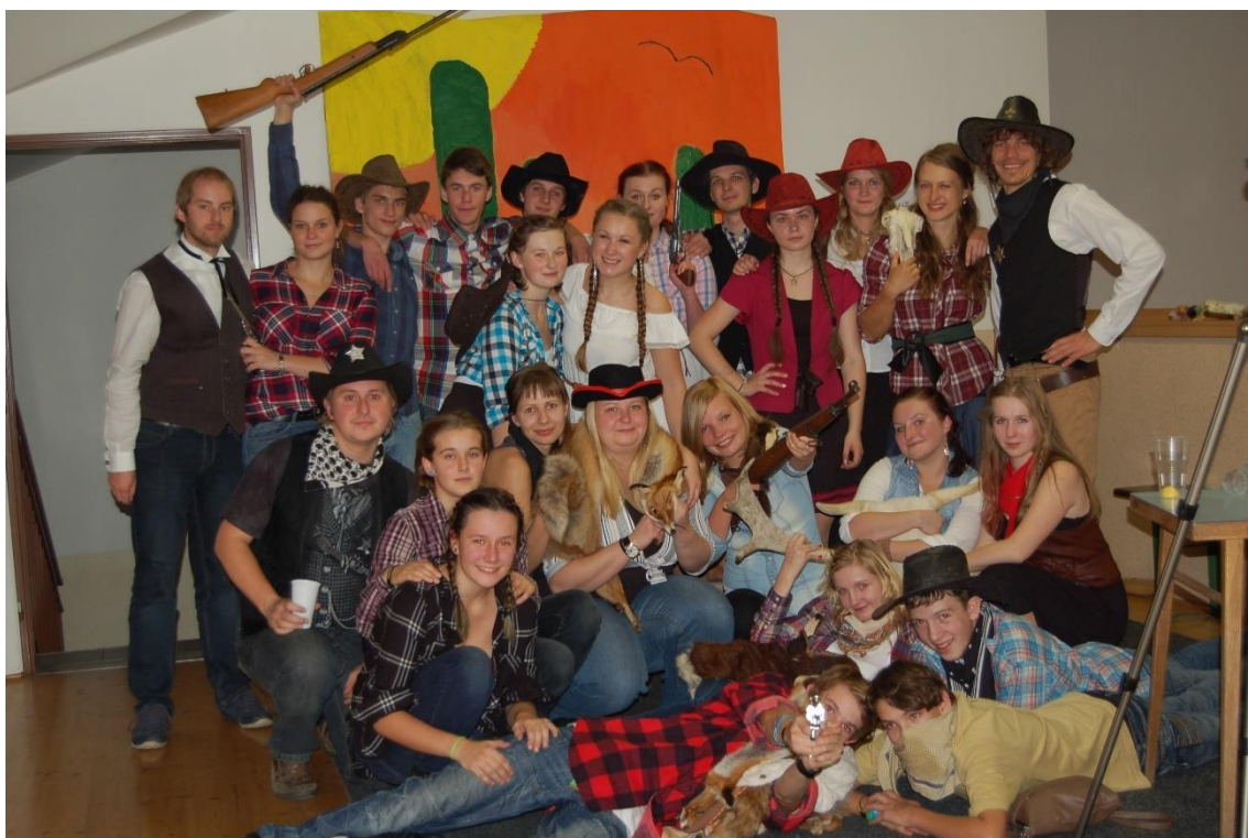
Účastníci Skautského countrybálu v bystřické Orlovně