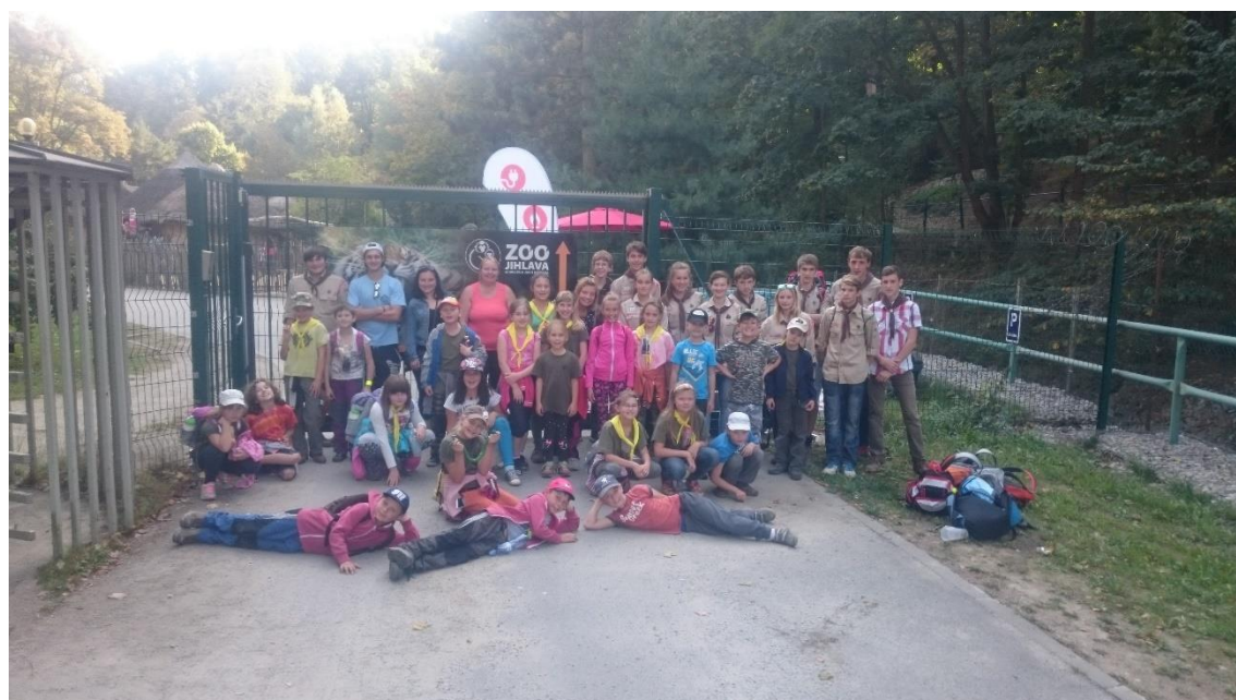
Výprava do Jihlavy