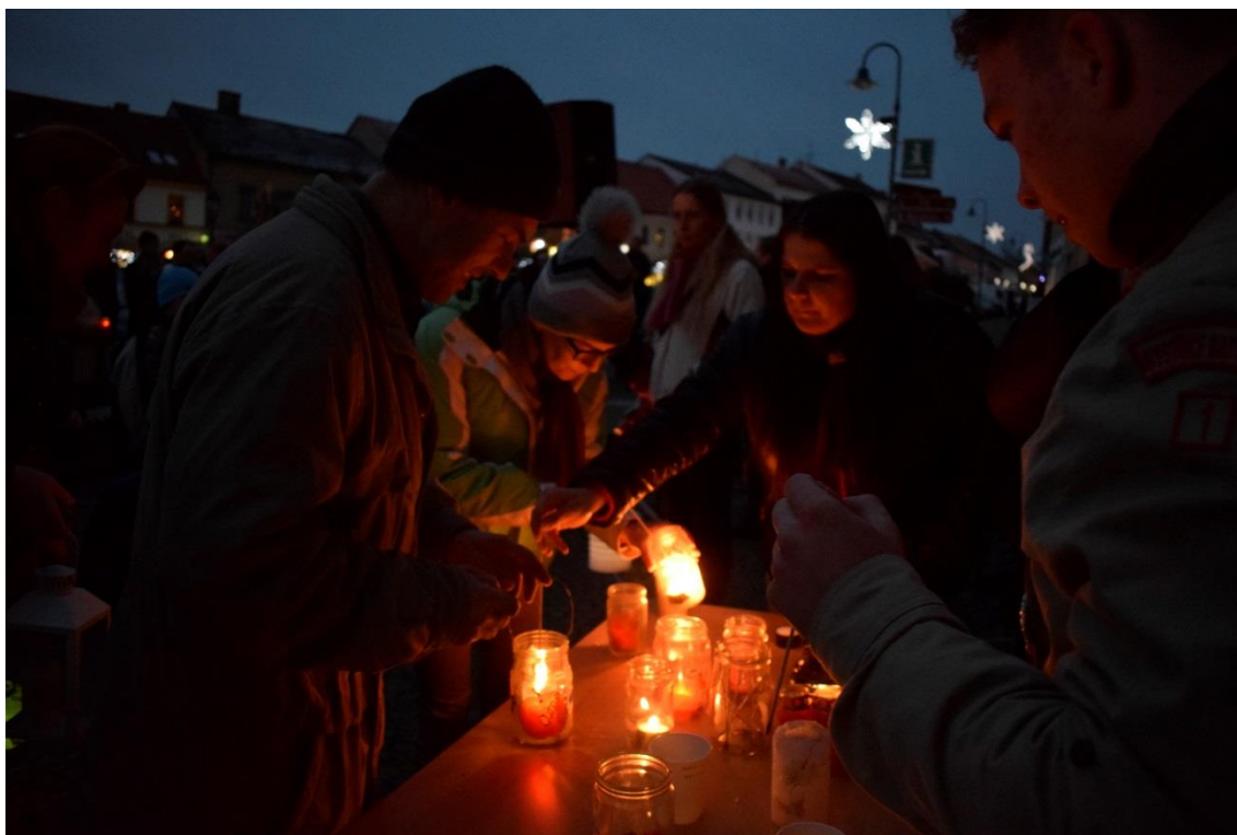
Rozdávání Betlémského světla na Masarykově náměstí

Další tradiční akcí, tentokrát z novodobé historie střediska, je Betlémské světlo . Rozdávání tohoto symbolu klidu a míru Vánoc a s ním spojený doprovodný program, jako je zpívání koled u vánočního stromu, lampionový průvod či návštěva domova důchodců, již neodmyslitelně patří ke službě skautů bystřickým občanům a pomáhá budovat pozitivní sociální citění našich nejmladších členů se staršími spoluobčany z domova důchodců, pro něž si připravujeme každoročně program, aby se na Vánoce necítili osaměle. Z této zpočátku nenápadné akce pro pár zájemců se tak v posledních letech stala vyhledávaná vánoční atrakce rodičů s dětmi, již se účastní až sto lidí a která se stala místem setkávání, vánočních blahopřání a pohodové atmosféry.