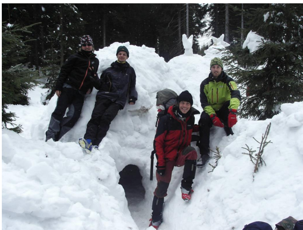
Zimní táboření v Jizerských horách