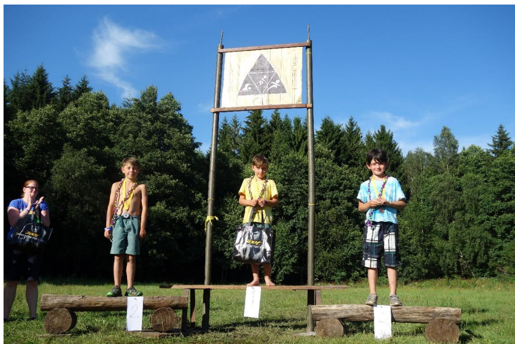
Vyhlášení vítězů skautského triatlonu Iron Scout