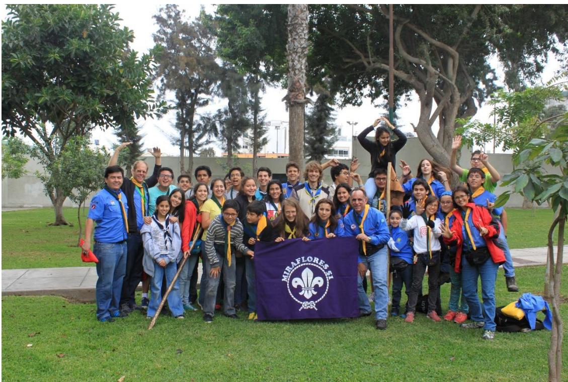
Výprava s peruánskými skauty z Limy