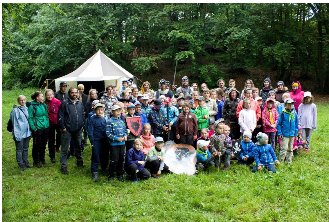
Společná fotka účastníků na nádvoří hradu Zubštejn