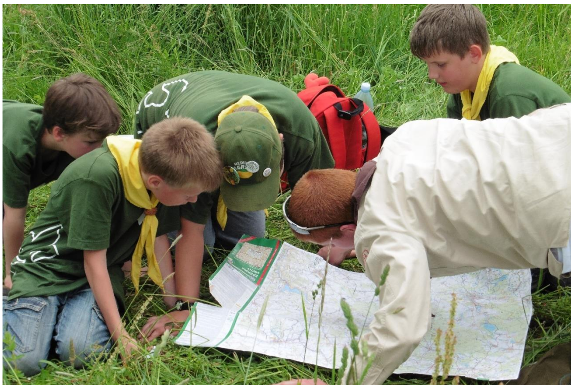
Orientace v terénu za použití mapy při Skautských závodech

komunikovat, umět vyhledávat informace, orientovat se nejen v přírodě ale všeobecně v neznámém prostředí, zvládat základy první pomoci a zdravotní péče nebo překonávat psychicky i fyzicky náročné úkoly. Jak obstojí v těchto dovednostech v konkurenci ostatních skautů a skautek si mohou každoročně vyzkoušet na Skautských závodech , v jejichž pořádání se střídají jednotlivá města a mající tříkolový postupový systém od kol základních, přes krajská až po kolo celorepublikové. Naše skautské středisko pravidelně pořádá základní kola a před dvěma lety mělo po delší době tu čest pořádat i kolo krajské, jehož se účastnilo šestnáct šestičlenných skautských družin z Kraje Vysočina. Dvoudenní zápolení se neslo v duchu Pirátů z Karibiku a kromě ryze skautských disciplín čekalo na závodící družiny lezení na venkovní umělé stěně, jízda zručnosti na lodi, řešení dopravní nehody či společné venkovní vaření. I přes rivalitu jednotlivých družin vládli na závodech přátelský duch, zakončený večerním zpíváním a hraním na kytary u ohně.