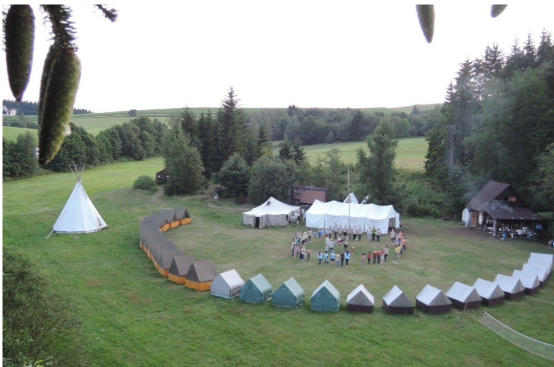
Pohled na místo konání skautského tábora na tábořišti Vojtěchov

Nejcharakterističtější a zároveň nejtradičnější událostí skautského roku je bezesporu letní stanový tábor . Pobyť pod stanem na čerstvém vzduchu, bez elektřiny mobilů a počítačů je v dnešní době jen stěží uvěřitelný. Ale tato tradice, která se od roku 1929 změnila naprosto minimálně a to navíc pod tíhou zákonných hygienických norem, je pro skauty natolik vlastní, že si bez ní skautský program nelze představit. Dva týdny, při nichž děti prožívají dobrodružství indiánů, rytířů, trpaslíků, princezen, egyptských faraonů, hrdinů knih či světoznámých cestovatelů, se stanou doživotním zážitkem na který se nedá zapomenout. Vznikají zde celoživotní přátelství a utváří se charakter osobnosti. Může být zima, často prší, občas se zasteskne po rodičích, ale to vše je následně zapomenuto jakmile jsou děti pohlceny skvělým programem, který jim dá zapomenout na veškeré výdobytky moderní doby. Za dva týdny intenzivních zážitků se často naučí více než za celý půlrok a odjíždějí z tábora s pocitem naprosté spokojenosti. Život v podsadových stanech bez topení, geniálním vynálezem českých skautů, je originální stejně jako život v indiánském tee-pee a ne nadarmo tento koncept používají i jiné dětské organizace. Tato ve světě již stoletá tradice patří k základním bodům skautského programu a jsme na ni náležitě hrdí.