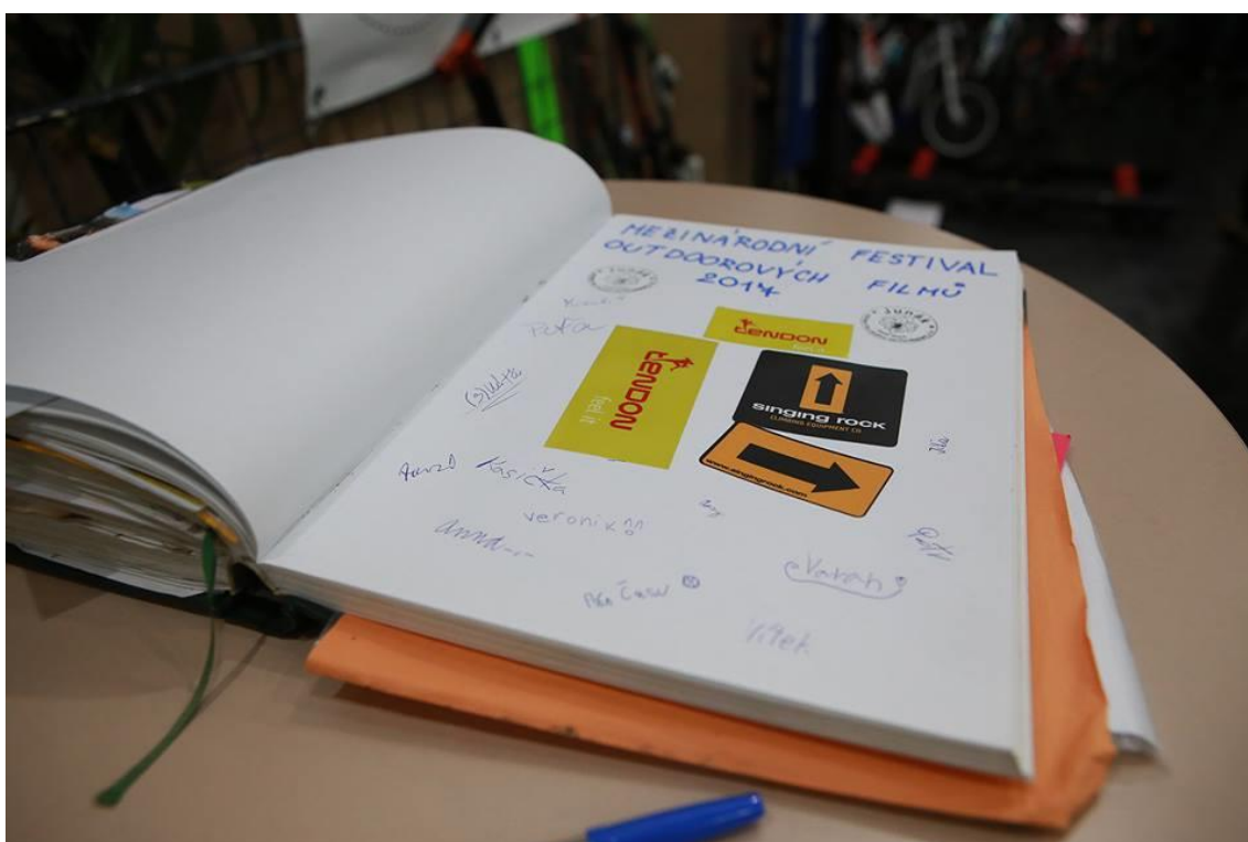
Skautská kronika s podpisy návštěvníků Mezinárodního festivalu outdoorových filmů

Vzhledem k zařazení různých aktivit v přírodě do skautské činnosti, jsme se zapojili ve spolupráci s městem Bystřice nad Pernštejnem a se spřáteleným spolkem HO Lezci z Vysočiny do organizace Mezinárodního festivalu outdoorových filmů . Jde o dnes již tradiční podzimní akci, při níž se kromě promítání filmů konají i besedy se známými osobnostmi. Současně jde i o prezentaci programu bystřických skautů. Mnoho našich členů je vášnivými vodáky, horolezci či skialpinisty, a proto můžeme divákům představit i náročnější skautské akce jako byla například expedice do Norska či Peru. Poslední dva roky jsme rovněž do programu festivalu zařadili programový blok Den bez handicapu, při němž společně s lezci připravujeme aktivity pro postižené spoluobčany, aby si i oni mohli okusit program v přírodě. Pro ostatní jsou naopak připravené aktivity, simulující pohyb s nějakým typem zdravotního postižení. Potvrzujeme tím, že skauting nezná hranic a že jsme schopni připravit i tak náročný program, jakým je MFOF.