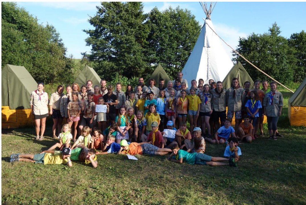
Účastníci tábora 2017