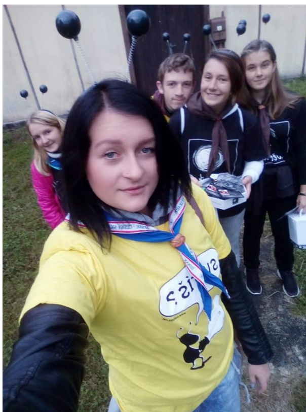
Členové střediska při sbírce Světluška

občanům. Bystřičtí skauti se dlouhodobě účastní sbírky Nadačního fondu Českého rozhlasu, známého pod názvem Světluška , jehož cílem je podporovat nevidomé a slabozraké. Světluška má pro nás také symbolický význam, neboť naše mladší členky jsou nazývány světluškami a tato akce má tak hezké propojení, kdy si i ti nejmenší uvědomí, že pomáhat ostatním, kteří neměli tolik štěstí co my, má smysl. Každoročně v září proto můžete potkat okřídlené světlušky s tykadly a skautskými šátky, vybírající peníze, které pomáhají potřebným. I díky důvěře ve skauty se vždy podaří vybrat přes 10.000Kč, což v součtu s ostatními skautskými středisky vytváří již velmi zajímavou sumu.