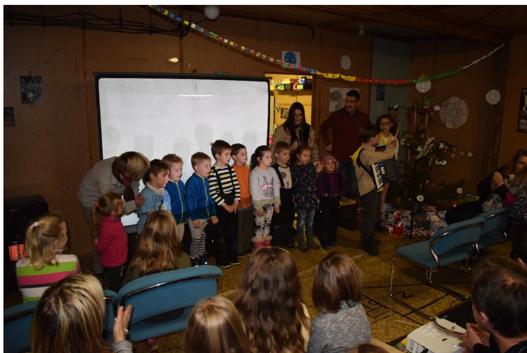
Vánoční besídka v klubovně