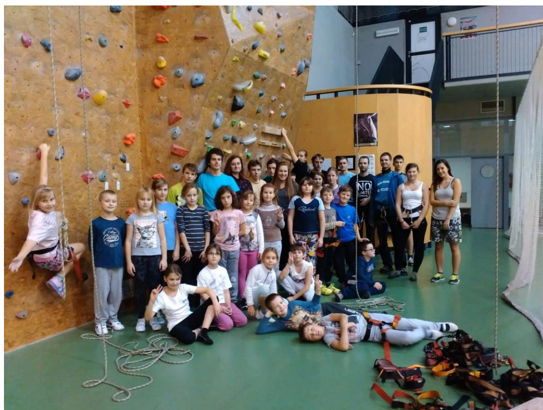
Lezení na umělé stěně