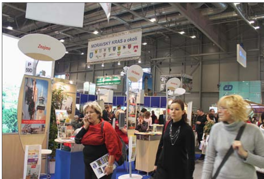
Návštěvníci Regiontouru 2010