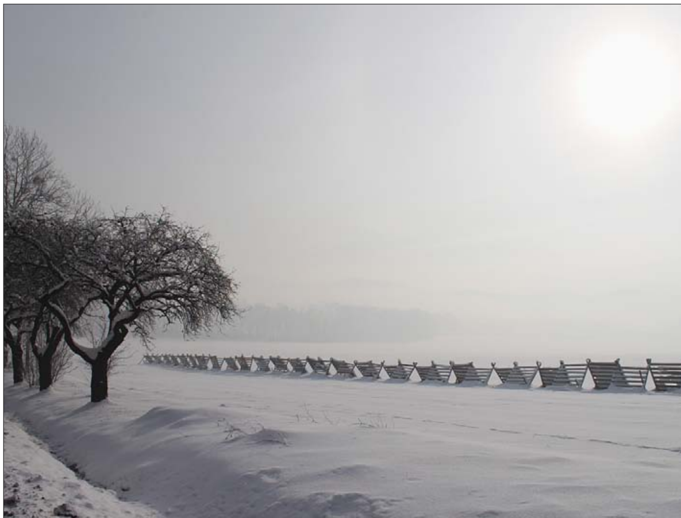
Mrázivý leden 2010 v Pobeskydí