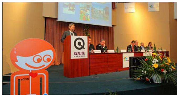
Ilustrační foto z 5. NKK v Olomouci

Témata konference: Vysvětlení vybraných nástrojů řízení kvality, podpora kvality pomocí ICT, komunikace s občanem, kvalita z pohledu rozvoje lidských zdrojů, inovace ve veřejné správě – příklady