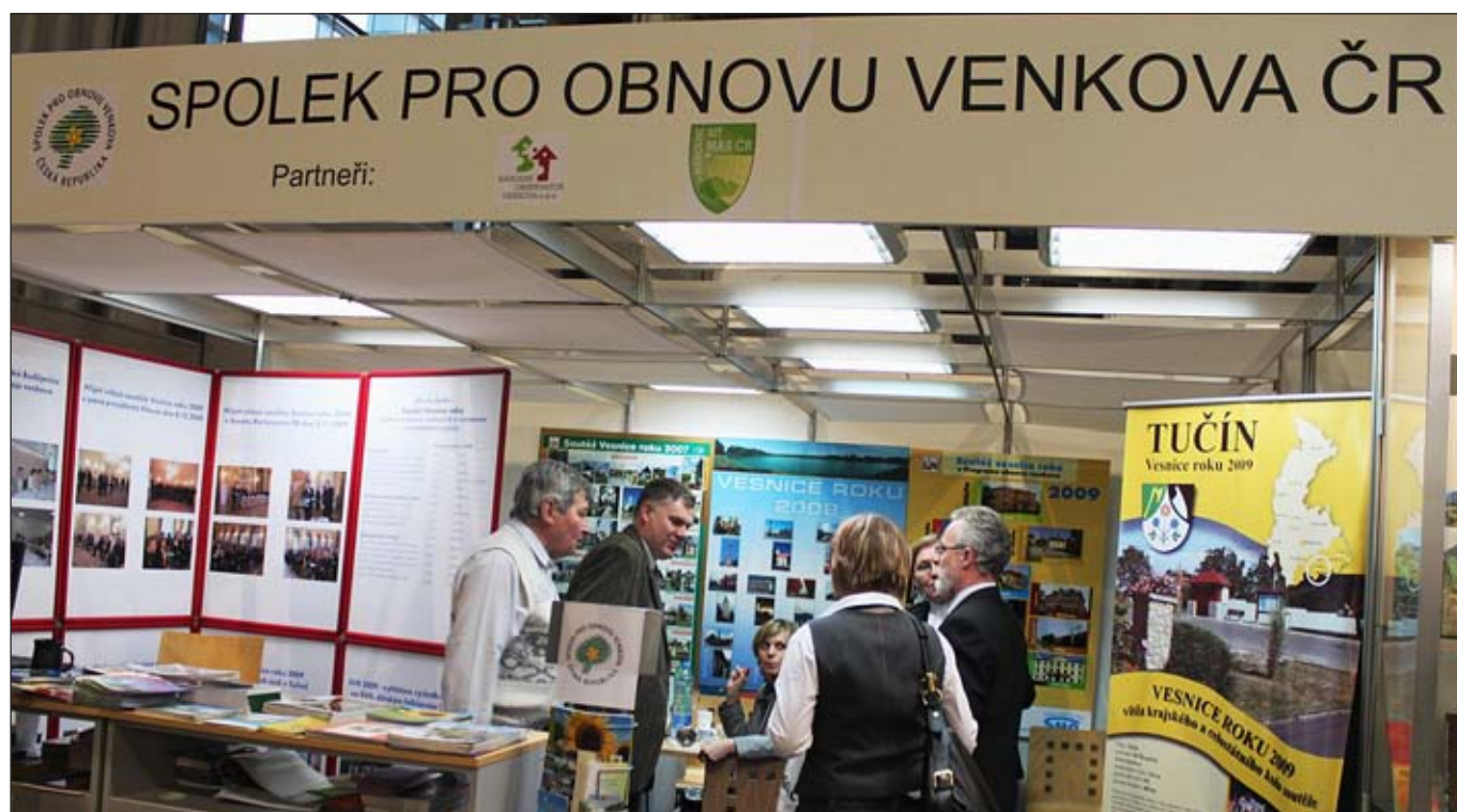
Stánek Spolku pro obnovu venkova na 19. ročníku Regionturu

Veletrh REGIONTOUR opětovně představil turistickou nabídku všech krajů České republiky, tuzemských regionů, měst, incommingových agentur a ve zvýšeném počtu i regionů z okolních zemí. Inspiraci k zahraničním cestám a pobytům přinesl jubilejní 20. ročník