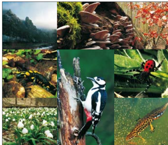
Fotografie: © Agentura ochrany přírody a krajiny ČR. Vytisknuto na EKO kartonu vyrobeném z recyklovaných vláknin.

Křivoklátsko patří mezi klenoty českého přírodního dědictví. Předmětem ochrany navrženého národního parku je rozsáhlý vnitrozemský komplex lesa nižších poloh s velkým podílem přirozených či lidskou činností málo ovlivněných ekosystémů, s výrazně vyvinutým říčním a vrcholovým fenoménem Berounky a jejích přítoků. Mimořádnou hodnotu mají zdejší lesy jako celek – tvoří největší lesní komplex ve vnitrozemí České republiky s mimořádně pestrým složením stromů a velkým podílem přírodních porostů. Křivoklátsko představuje jedinečný fenomén, který není v soustavě našich národních parků zastoupen, je zcela odlišný od NP České Švýcarsko, Krkonoše a Šumava. V některých rysech ho lze srovnat