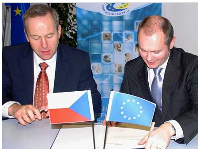
Ministr pro místní rozvoj Rostislav Vondruška a hejtman Jihomoravského kraje a předseda Asociace krajů ČR Michal Hašek na veletrhu Regiontour v Brně